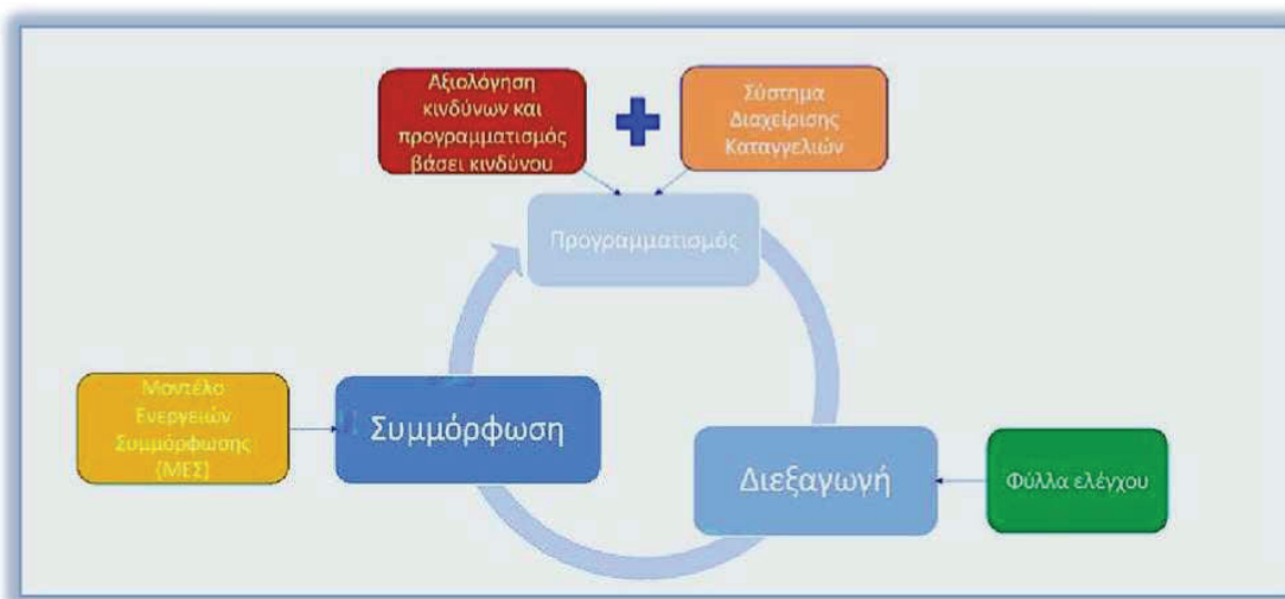
Εικόνα 1: Κύκλος Εποπτείας

Στην εικόνα 1 σχηματοποιείται ο κύκλος εποπτείας απεικονίζοντας τα εποπτικά εργαλεία που χρησιμοποιούνται και η θέση του ΜΕΣ.