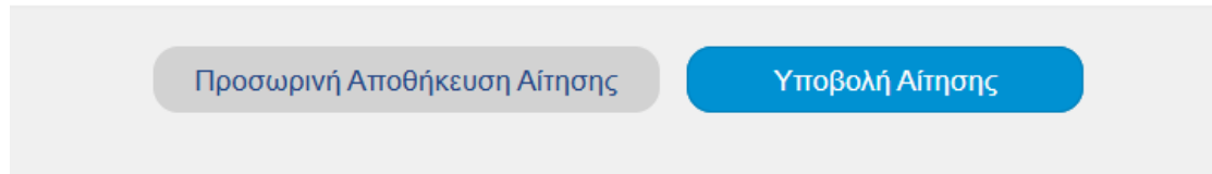
Εικόνα 9. Επιλογή υποβολής αίτησης

Προκειμένου να υποβάλετε αίτηση, θα πρέπει απλώς να «πατήσετε» στο πεδίο «Υποβολή αίτησης».